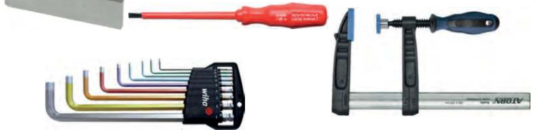
② Schraubendreher PAL-Bereitstellungsunterlagen (Set)