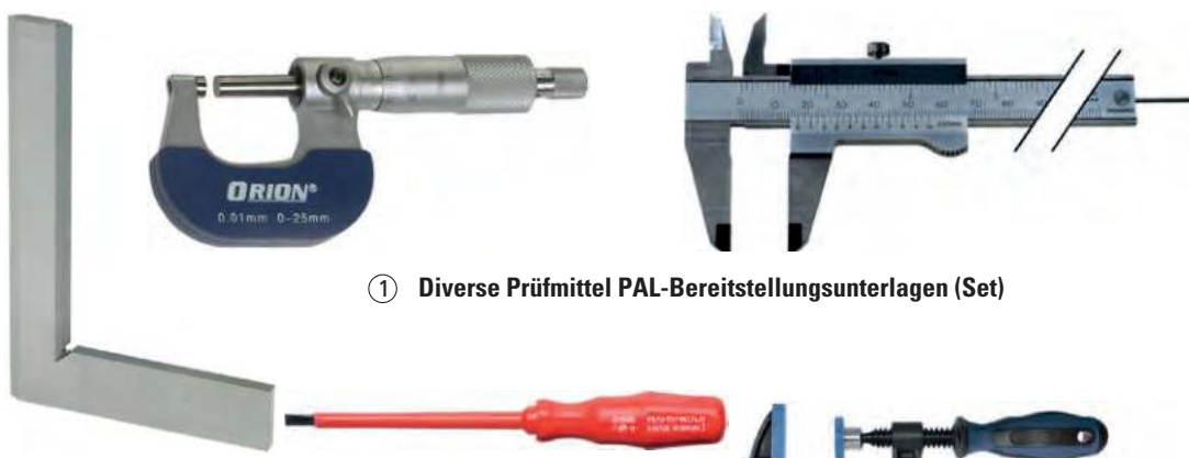
① Diverse Prüfmittel PAL-Bereitstellungsunterlagen (Set)