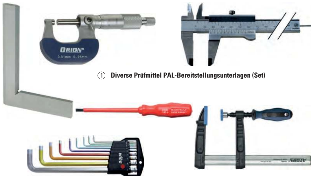
① Diverse Prüfmittel PAL-Bereitstellungsunterlagen (Set)