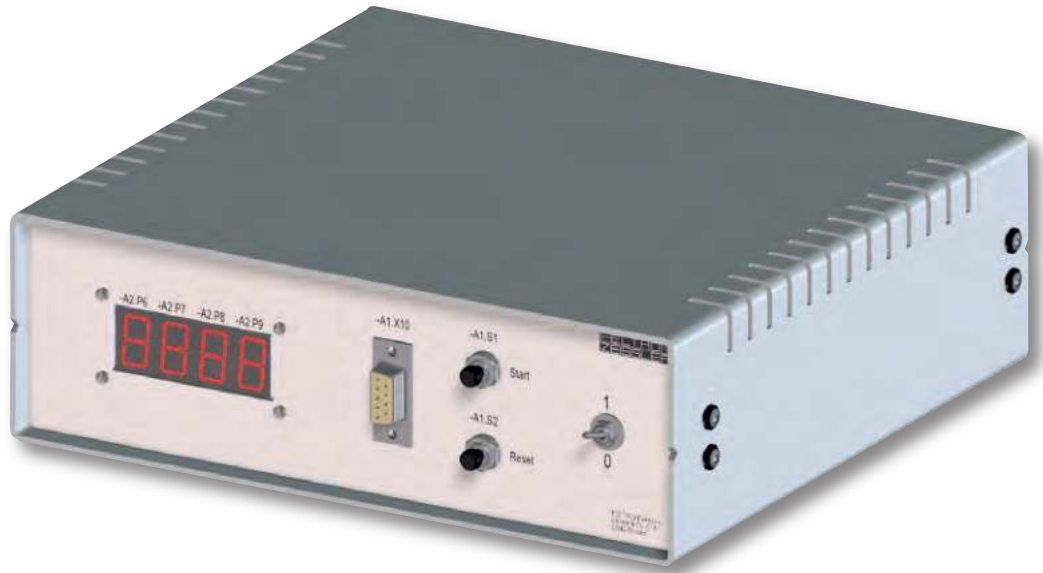
Baugruppe A1 Frontplatte mit Bestückung