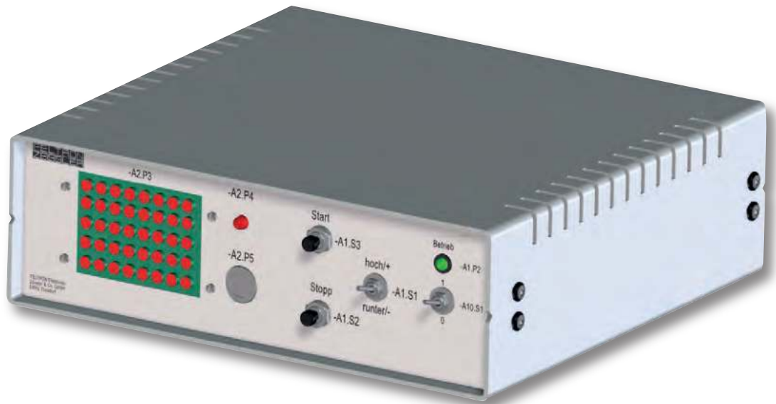
Baugruppe A1 Frontplatte mit Bestückung