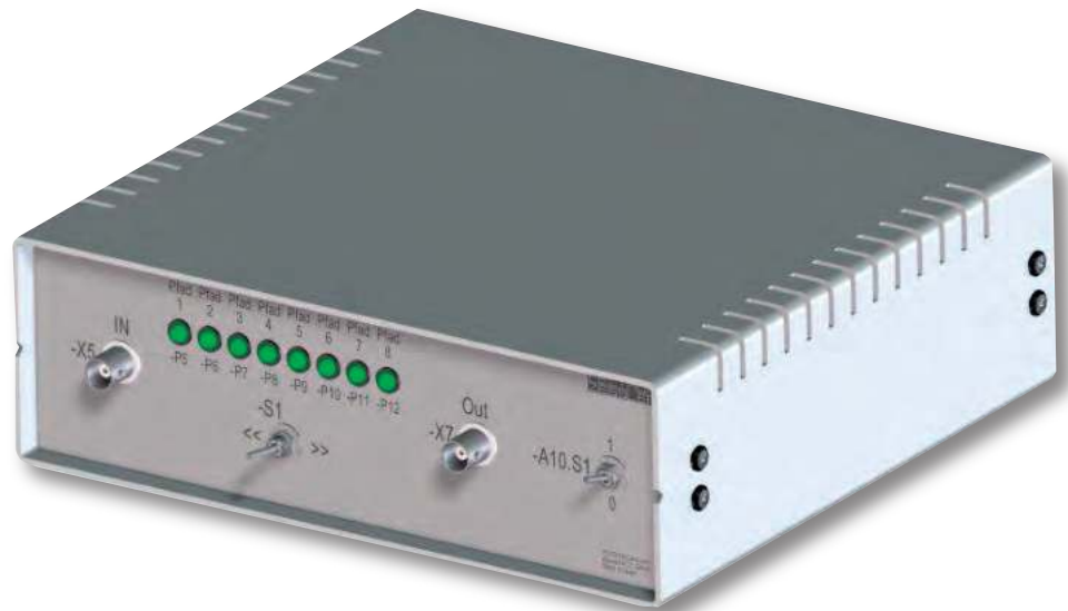
Baugruppe A1 Frontplatte mit Bestückung