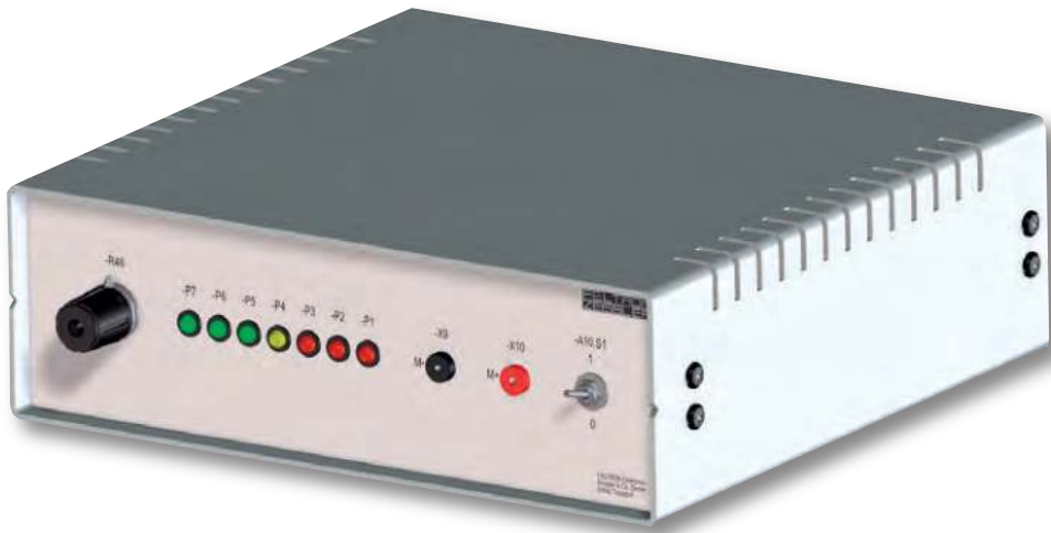
Baugruppe A1 Frontplatte mit Bestückung