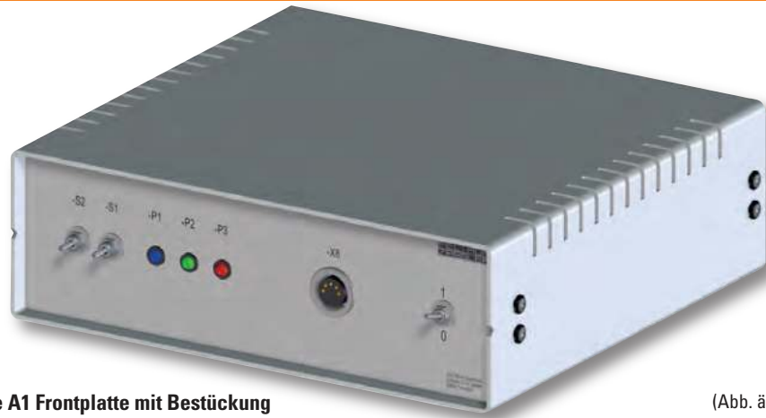
Baugruppe A1 Frontplatte mit Bestückung