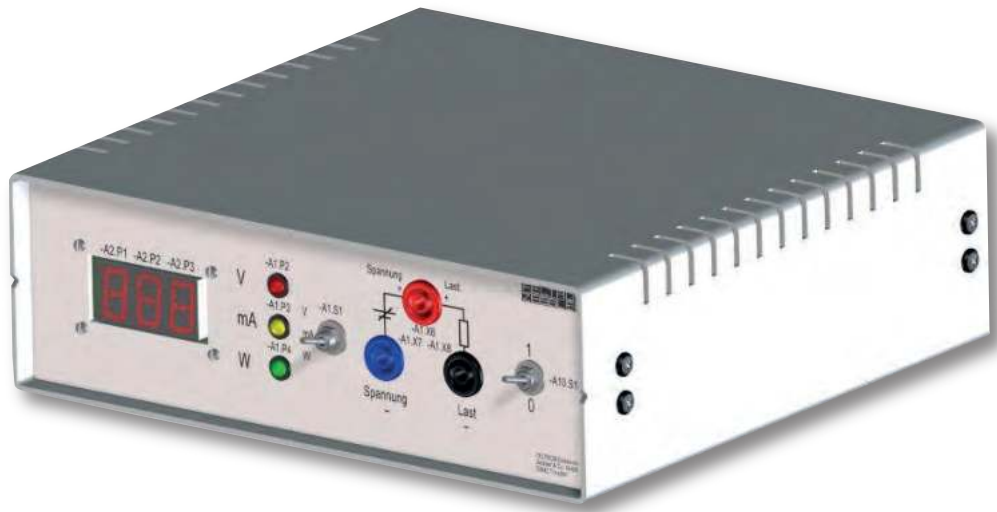
Baugruppe A1 Frontplatte mit Bestückung