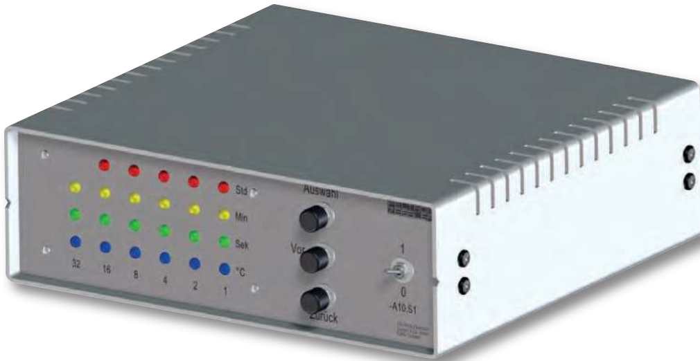
Baugruppe A1 Frontplatte mit Bestückung