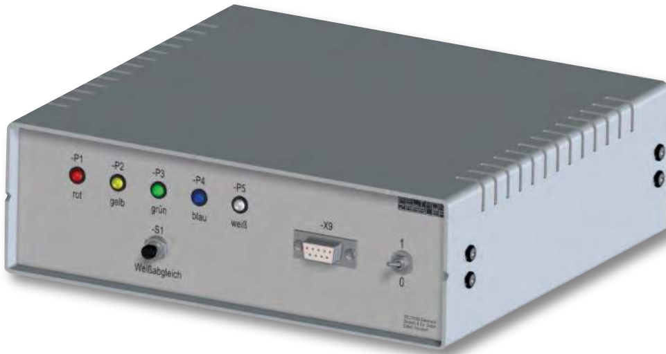
Baugruppe A1 Frontplatte mit Bestückung