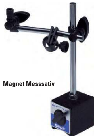
⑥ Magnet Messsativ