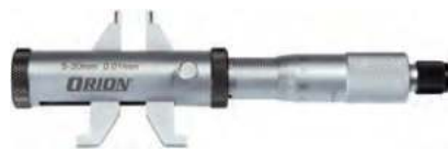
④ Innenmessschraube mit Messschnäbel