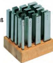
⑤ Parallelendmaß (Parallel gauge)