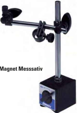
⑥ Magnet Messsativ