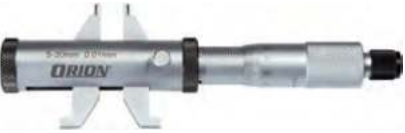
④ Innenmessschraube mit Messschnäbel