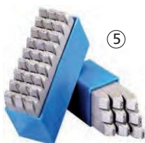
Abb. S. 112 + 113